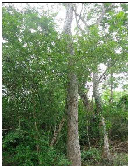
Tabebuia impetiginosa (Tajibo morado) Pag. 104-115